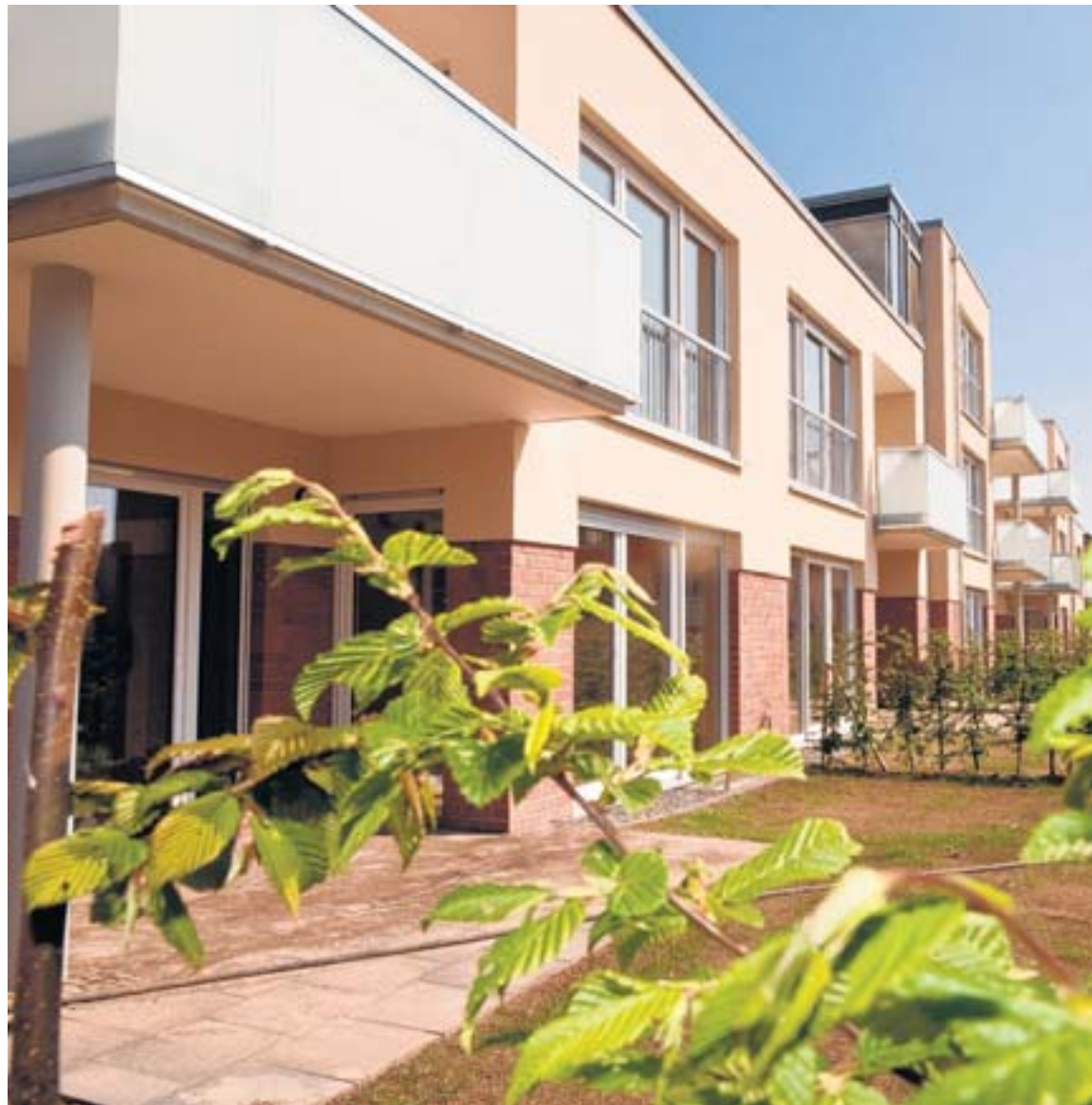
Abchnitt eins der Solarsiedlung in Garath wird derzeit fertiggestellt und ist ab Mai bezugsfertig. Die Wohnungen sind von 55 bis über 90 Quadratmeter groß.